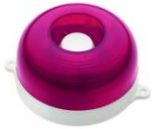
МАЯК-12-КП, МАЯК-24-КП оповещатель комбинированный