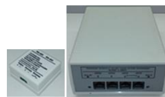
УСО Контроллер сегмента