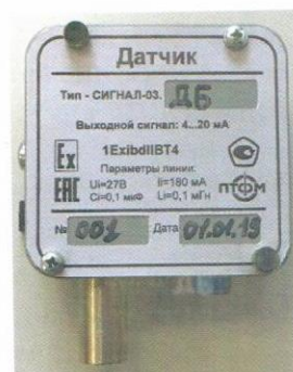
Датчик углеводородов в атмосферном воздухе (силуминовый корпус)