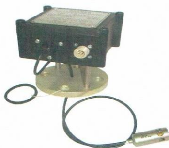
Датчик паров бензина в атмосфере азота с фланцем для установки на резервуаре (пластмассовый корпус)