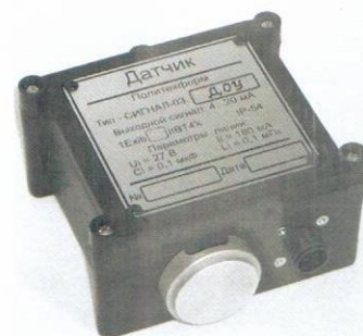
Датчик токсичных газов или кислорода (пластмассовый корпус)